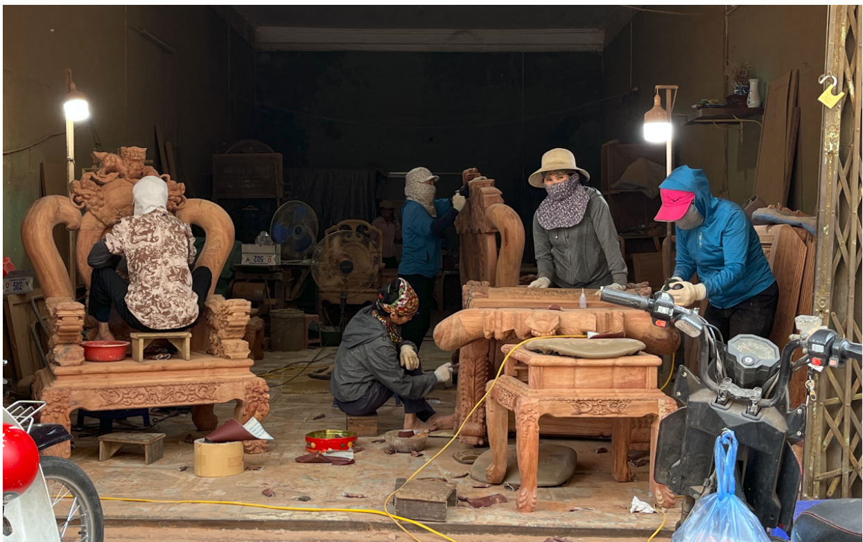
Ảnh 2: Các nữ công nhân đang chà nhám đồ gỗ tại làng nghề Đồng Kỵ.

Trong quá trình sản xuất, người chồng đảm nhiệm tuyển dụng thợ, phân công công việc, giám sát sản xuất và kiểm soát chất lượng đầu ra của sản phẩm, còn người vợ đảm nhận công việc ghi chép công lao động, tính toán và thanh toán lương cho thợ vào cuối tháng. Về mặt điều hành, người chồng chủ yếu quản lý tại xưởng sản xuất, trong khi người vợ quản lý cửa hàng, thực hiện các chức năng tài chính kế toán, giữ tiền mặt, thanh toán cho nhà cung cấp và thu hồi công nợ từ khách hàng. Trong hoạt động kinh doanh, người vợ thường phụ trách chăm sóc khách hàng hiện hữu nhờ mối quan hệ gần gũi, trong khi người chồng đóng vai trò mở rộng thị trường và tìm kiếm khách hàng mới. Trước đây, quyết định liên quan đến mẫu mã và sản lượng sản xuất chủ yếu do người chồng đưa ra. Tuy nhiên, hiện nay người vợ cũng tham gia vào quá trình này do thường xuyên tiếp xúc với khách hàng và nắm bắt nhanh hơn nhu cầu thị trường.