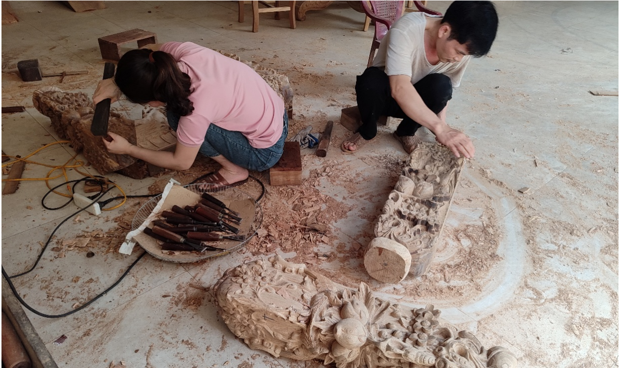
Ảnh 4: Một hộ gia đình đang chạm trổ hoàn thiện chân bàn thờ tại làng nghề La Xuyên

lao động linh hoạt và tăng cường bình đẳng giới là cần thiết để các làng nghề mộc có thể phát triển mạnh mẽ và thích nghi với xu thế mới.