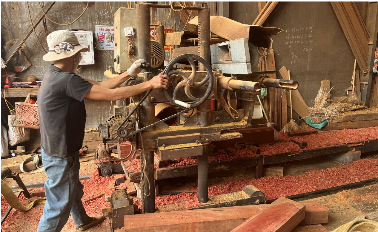
Ảnh 3: Một công nhân đang vận hành máy xẻ ở làng nghề Chàng Sơn (Hà Nội).

Ở cấp độ người lao động làm thuê tại các xưởng, sự phân công lao động theo giới cũng thể hiện một cách rõ rệt và có tính hệ thống. Nhìn chung, lao động nam đảm nhiệm các công việc nặng nhọc (vận chuyển gỗ, bốc xếp hàng hóa), các công đoạn đòi hỏi kỹ thuật cao (xẻ gỗ, pha phôi, làm mộng, gia công tinh), cũng như các công việc tiềm ẩn nguy cơ độc hại (sơn). Trong khi đó, lao động nữ thường được phân công thực hiện những công việc nhẹ, yêu cầu tính tỉ mỉ và bền bỉ nhưng không cần kỹ thuật chuyên sâu, như đánh giấy ráp, chà nhám và đóng gói thành phẩm. Đối với sản phẩm đồ gỗ mỹ nghệ – lĩnh vực đòi hỏi tay nghề tinh xảo – cả thợ nam và thợ nữ đều có thể tham gia vào công đoạn chạm đục. Tuy nhiên, vai trò của thợ nữ thường giới hạn ở các thao tác đơn giản, như tạo hình ban đầu hoặc đục các chi tiết sơ cấp; còn thợ nam phụ trách các chi tiết phức tạp hơn và hoàn thiện sản phẩm cuối cùng.