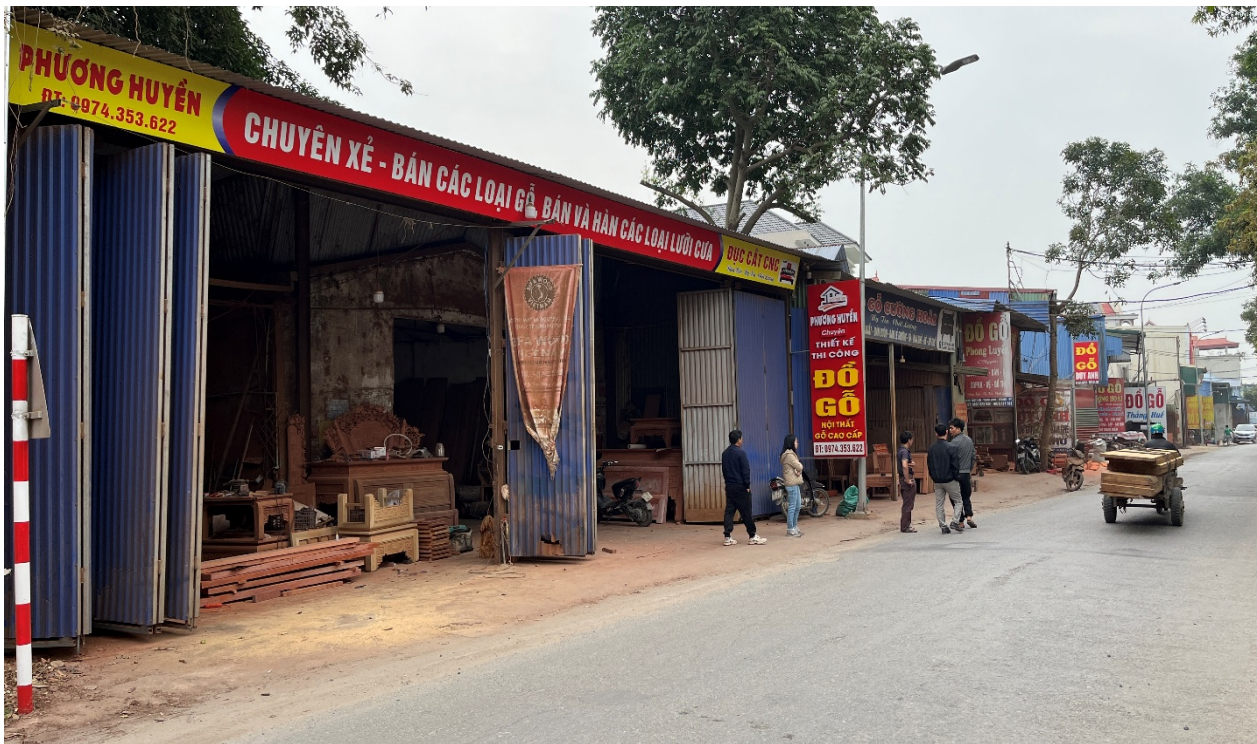
Ảnh 1: Quang cảnh làng nghề Thụy Lâm (Hưng Yên) năm 2025

Tuy nhiên, trong những năm gần đây, do quá trình đô thị hóa gia tăng và sự mở rộng của các khu công nghiệp tới các tỉnh, thành tập trung nhiều làng nghề gỗ như Hà Nội, Bắc Ninh, Hưng Yên, Nam Định, Vĩnh Phúc, v.v., các làng nghề đang mất dần nguồn lao động địa phương do thế hệ lao động trẻ thích tìm kiếm công việc cố định, thu nhập ổn định, môi trường làm việc an toàn hơn tại các công ty, xưởng sản xuất quy mô lớn hơn. Mặt khác, do nhu cầu mua sắm đồ gỗ tại thị trường nội địa sụt giảm mạnh trong bối cảnh suy giảm kinh tế sau đại dịch COVID-19, nhiều hộ/ nhân công tham gia chế biến gỗ quy mô nhỏ tại làng nghề không thể duy trì công việc bằng nghề mộc đã dần dịch chuyển sang các ngành nghề khác cho thu nhập ổn định hơn như bán hàng, lái taxi, giao hàng, v.v. Chỉ có các chủ xưởng đã hoạt động lâu năm, có tích lũy tài chính và nguồn lực khác như đất đai, nhà xưởng, máy móc, tệp khách hàng quen mới có thể duy trì được hoạt động sản xuất dù quy mô cũng bị ảnh hưởng tương đối lớn.