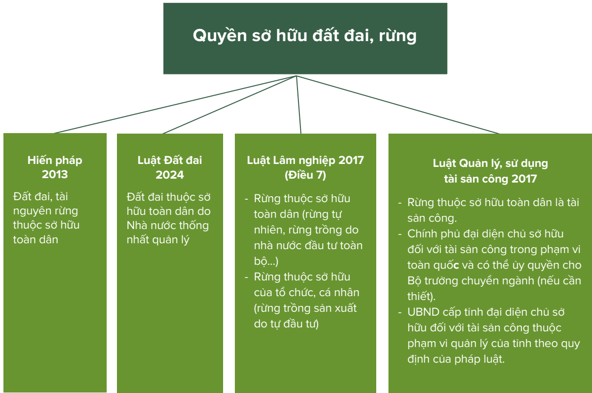
Hình 2: Quyền sở hữu đất đai và rừng

Theo Luật Quản lý, sử dụng tài sản công năm 2017 (Điều 4), rừng thuộc sở hữu toàn dân là tài sản công; Chính phủ thực hiện chức năng đại diện chủ sở hữu đối với tài sản công trong phạm vi toàn quốc; Bộ thực hiện quyền, trách nhiệm của đại diện chủ sở hữu đối với tài sản công thuộc phạm vi quản lý và phân cấp, ủy quyền của Chính phủ; UBND cấp tỉnh thực hiện quyền, trách nhiệm của đại diện chủ sở hữu đối với tài sản công thuộc phạm vi quản lý của tỉnh 6 theo quy định của pháp luật. Theo Luật Tổ chức Chính phủ năm 2025, Luật Lâm nghiệp năm 2017 7 , Chính phủ có thể ủy quyền hoặc phân công Bộ trưởng Bộ NN&MT - với tư cách là thành viên Chính phủ chịu trách nhiệm quản lý nhà nước về lâm nghiệp, đại diện chủ sở hữu tài sản công.