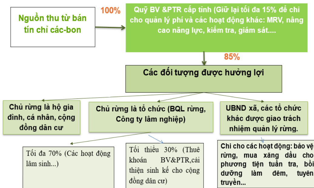
Hình 4: Cơ chế sử dụng tiền thu từ tín chỉ các-bon rừng trong trường hợp UBND cấp tỉnh ký hợp đồng

Lý do đề xuất: Hiện nay có đối tác quốc tế đề xuất mua bán, chuyển nhượng kết quả giảm phát thải/tín chỉ các-bon rừng tiếp cận theo chương trình, dự án cấp tỉnh, nên UBND cấp tỉnh có đủ thẩm quyền tham gia vào mua bán, chuyển nhượng kết quả giảm phát thải/tín chỉ các-bon rừng.