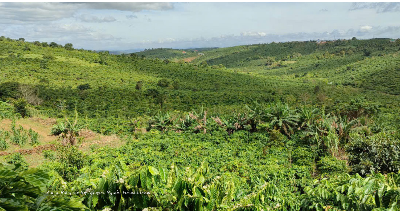
Ảnh 3: Rừng núi Tây Nguyên.

Để trả lời câu hỏi ấy, cần trở lại với một Tây Nguyên đại ngàn.