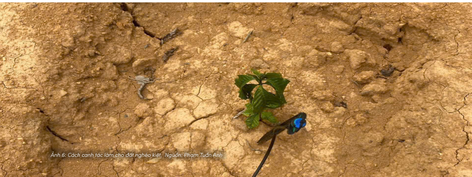
Ảnh 6: Cách canh tác làm cho đất nghèo kiệt.

Điều đáng lo ngại là quá trình ấy thường diễn ra rất chậm và khó nhận biết. Khi những dấu hiệu suy yếu đã hiện rõ trên cây trồng hoặc năng suất bắt đầu giảm sút, nhiều tổn thương trong lòng đất có thể đã tích tụ từ nhiều năm trước. Chính vì vậy, cái giá phải trả cho sự suy thoái đất thường không xuất hiện ngay lập tức, mà âm thầm chuyển thành những rủi ro lâu dài đối với sản xuất nông nghiệp và sinh kế của người dân.