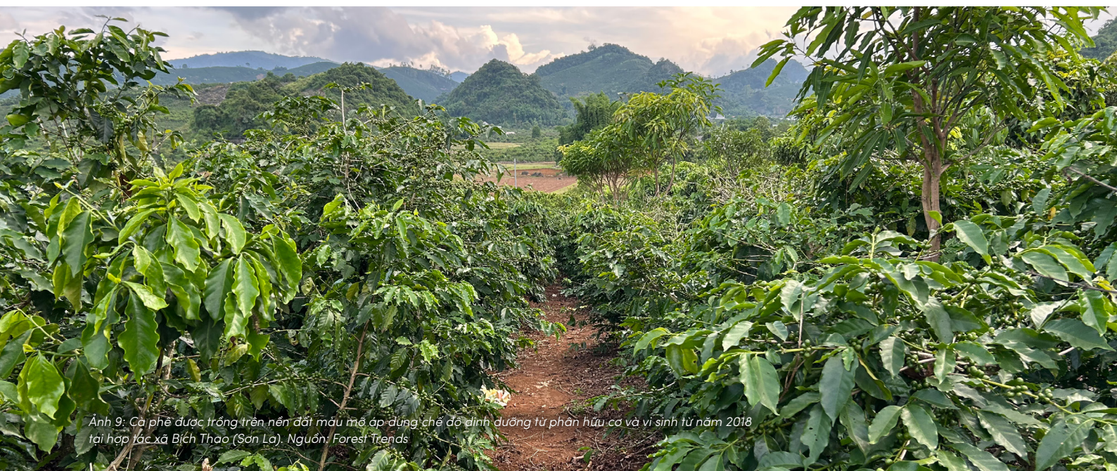
Ảnh 9: Cà phê được trồng trên nền đất màu mỡ áp dụng chế độ dinh dưỡng từ phân hữu cơ và vi sinh từ năm 2018 tại hợp tác xã Bích Thao (Sơn La).

Bên cạnh vấn đề quyền và đại diện, các cuộc thảo luận cũng thường xoay quanh việc làm thế nào để dung hòa giữa nhu cầu phát triển của con người với các giới hạn sinh thái của tự nhiên. Phần lớn các học giả hiện nay không xem quyền của đất là một khái niệm đối lập với phát triển, mà là một nỗ lực nhằm xác lập những giới hạn cần được tôn trọng để các hệ sinh thái tiếp tục duy trì các chức năng sống của mình trong dài hạn.