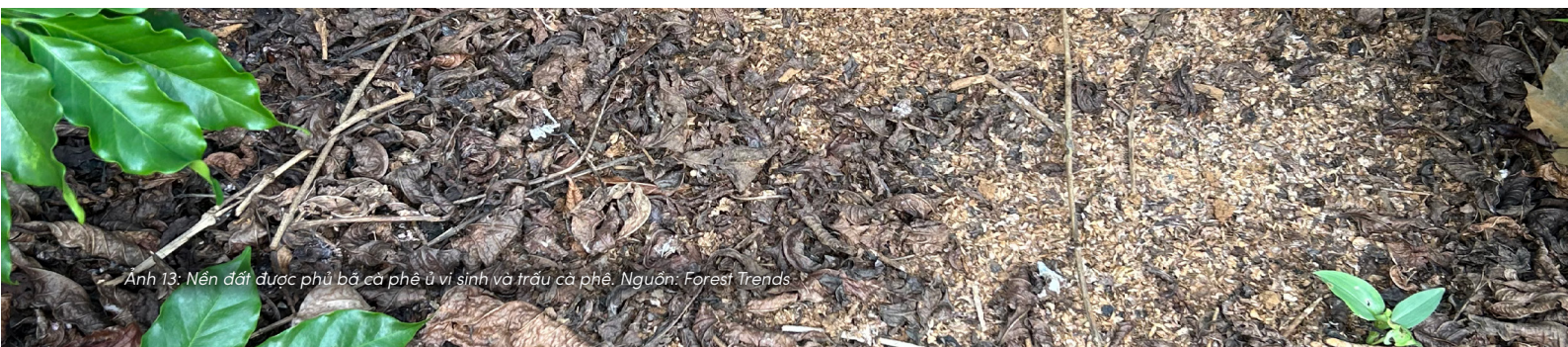
Ảnh 13: Nền đất được phủ bởi bã cà phê ủ vi sinh và trấu cà phê.

Mỗi quyền tự thân được đề xuất trong chuyên luận này đều phản ánh một giới hạn sinh thái mà đất cần được duy trì để tiếp tục thực hiện các chức năng sống của mình. Do đó, mọi hoạt động khai thác và sử dụng đất cần tránh gây xói mòn, ô nhiễm, suy giảm đa dạng sinh học hoặc những tác động vượt quá khả năng tự phục hồi của hệ đất.