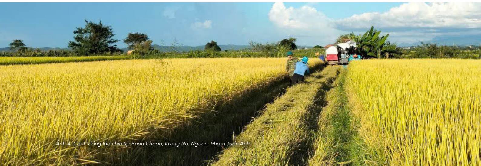
Ảnh 4: Cảnh đồng lúa chín tại Buôn Choah, Krông Nô.

Tháng Ba, mùa con ong đi lấy mật, cũng là lúc nhiều buôn làng bắt đầu tìm đất cho mùa rẫy mới. Già làng cùng những thanh niên trai tráng mang theo xà gạt băng qua rừng, lội qua suối và thác ghềnh để tìm nơi đất có màu đỏ tươi, lớp mùn dày, nguồn nước trong. Trước khi phát dọn, họ làm lễ cúng Yàng để xin phép thần linh và cầu mong một mùa vụ thuận lợi.