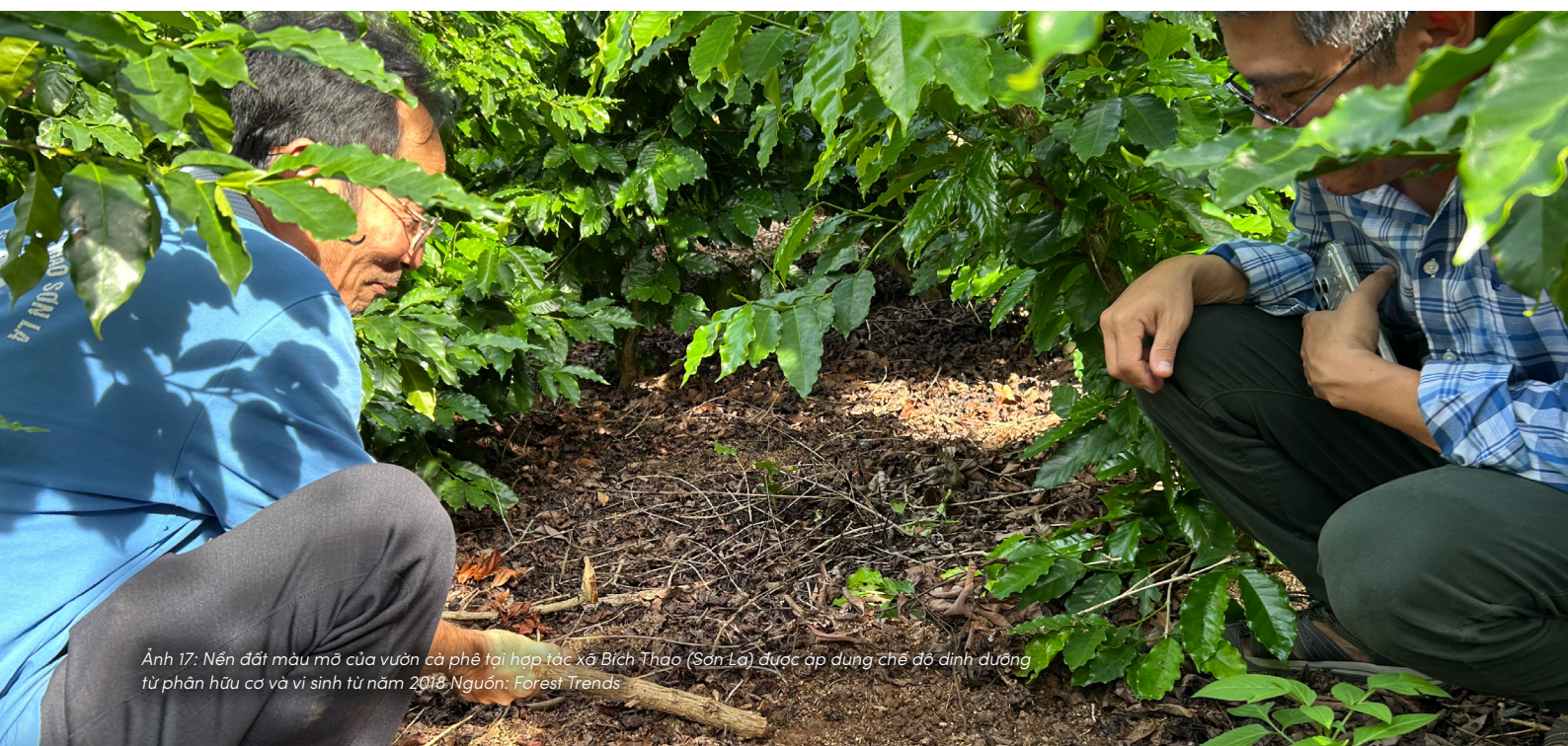
Ảnh 17: Nền đất màu mỡ của vườn cà phê tại hợp tác xã Bích Thảo (Sơn La) được áp dụng chế độ dinh dưỡng từ phân hữu cơ và vi sinh từ năm 2018.

Bổn phận đền đáp không phải là một nghĩa vụ được áp đặt từ bên ngoài. Nó xuất phát từ sự thấu hiểu rằng những gì chúng ta nhận được hôm nay là kết quả của sự tích lũy từ quá khứ, và những gì chúng ta để lại sẽ góp phần định hình tương lai. Chính sự kết nối ấy làm nên nền tảng đạo đức sâu xa của quyền của đất.