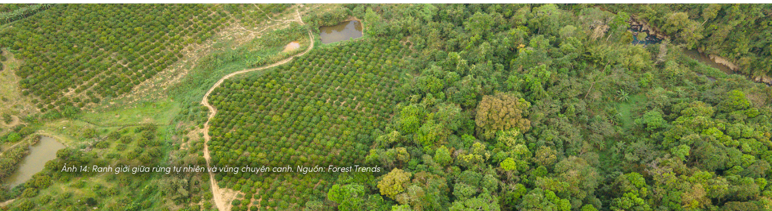
Ảnh 14: Ranh giới giữa rừng tự nhiên và vùng chuyên canh.

Theo đó, quyền của đất không đối lập với quyền của con người. Ngược lại, nó xuất phát từ nhận thức rằng tương lai của con người phụ thuộc vào sức khỏe của đất. Khi đất bị suy thoái,