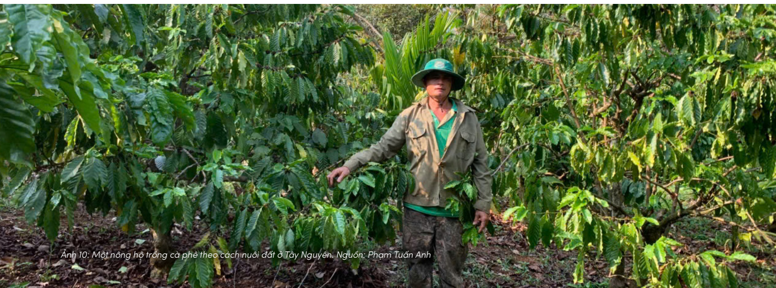
Ảnh 10: Một nông hộ trồng cà phê theo cách nuôi đất ở Tây Nguyên.

Nhiều kinh nghiệm sản xuất truyền thống phản ánh cách nhìn ấy. Cha ông không xem đất là nguồn lợi có thể khai thác vô hạn. Trong tư duy canh tác của người xưa, việc sử dụng đất luôn gắn với những giới hạn nhằm duy trì khả năng sinh lợi lâu