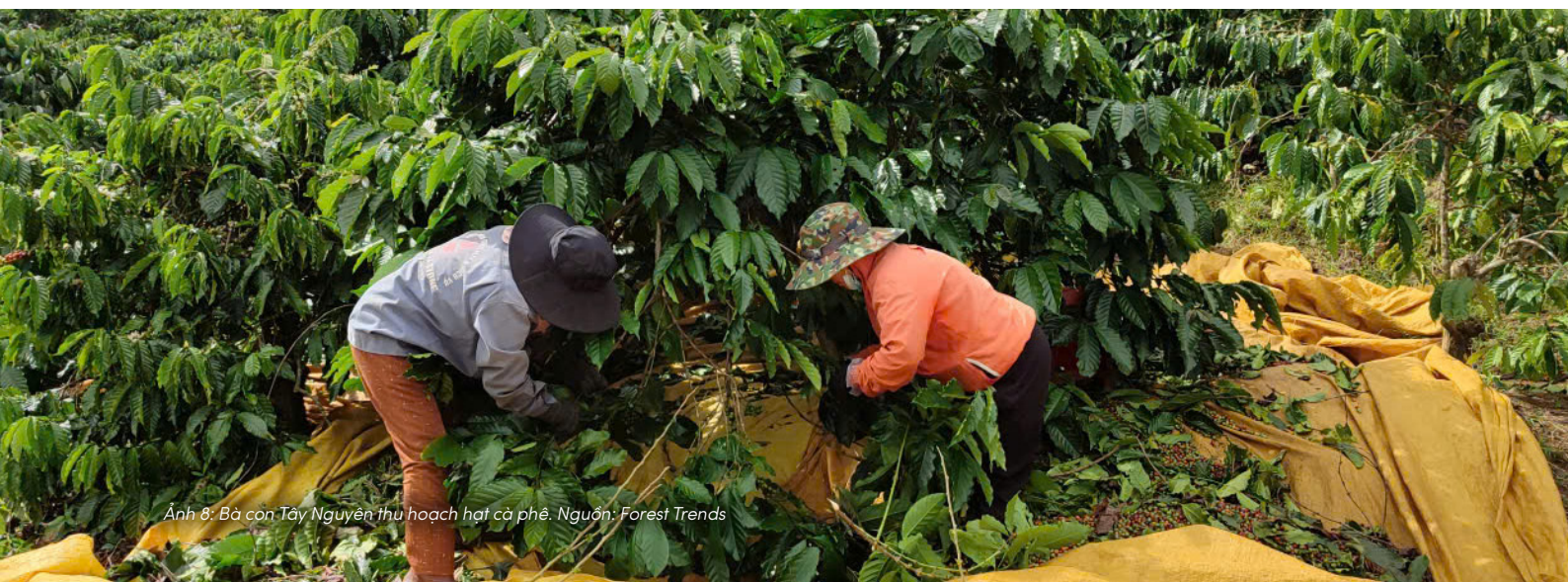
Ảnh 8: Bà con Tây Nguyên thu hoạch hạt cà phê.

Từ góc nhìn khoa học hiện đại, đất không chỉ tạo ra lương thực. Đất còn điều hòa dòng chảy nước, lưu giữ các-bon, hỗ trợ đa dạng sinh học và góp phần duy trì sự ổn định của nhiều hệ sinh thái tự nhiên. Chính vì vậy, ngày càng nhiều nhà khoa học và tổ chức quốc tế xem sức khỏe đất là một trong những nền tảng của phát triển bền vững.