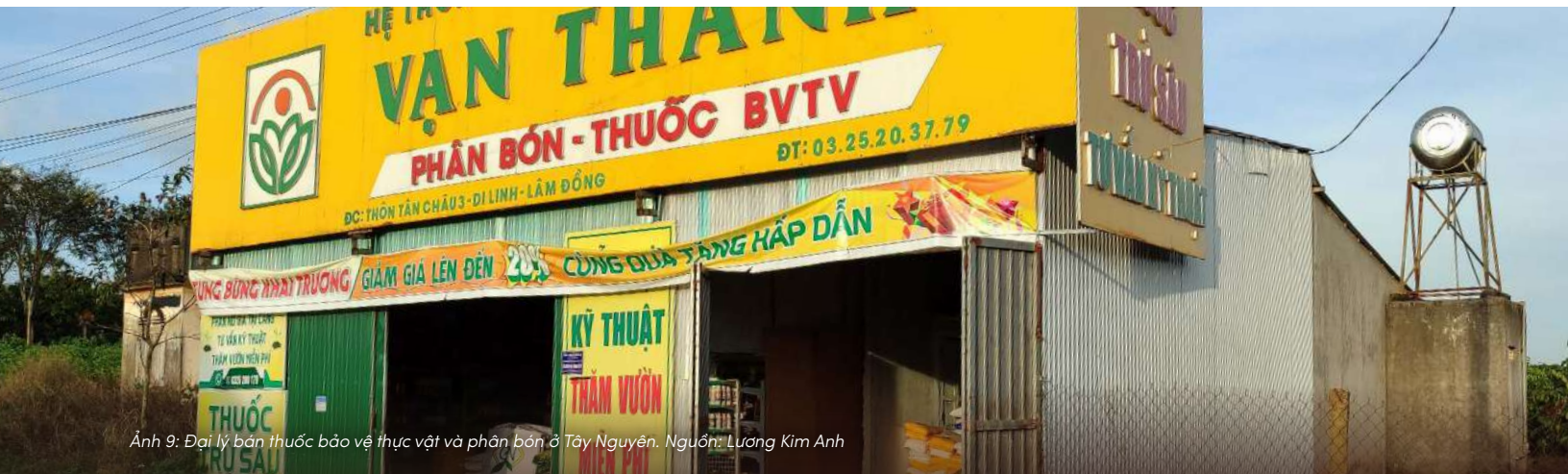
Ảnh 9: Đại lý bán thuốc bảo vệ thực vật và phân bón ở Tây Nguyên.

Trong hoàn cảnh đó, nhiều quyết định tương tự chưa tốt cho đất lại là những lựa chọn có thể hiểu được.