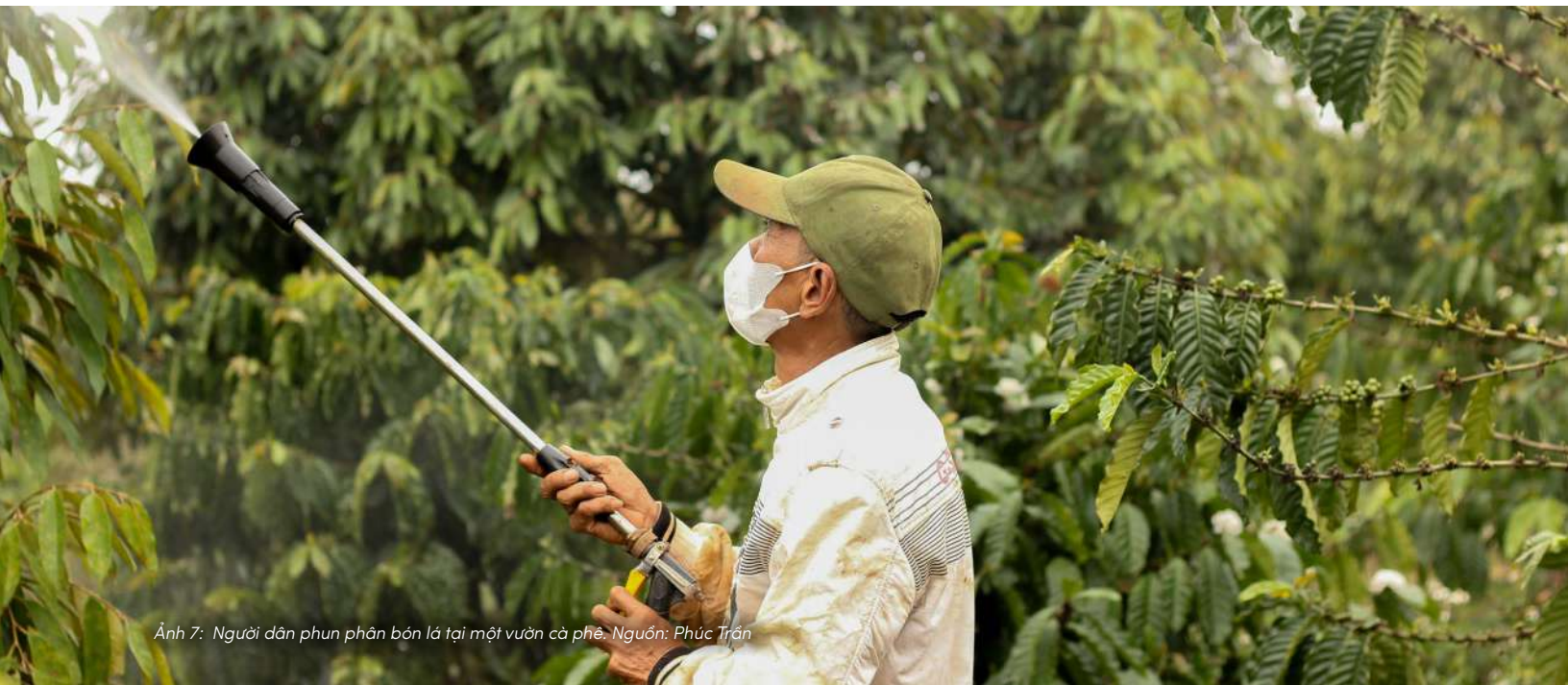
Ảnh 7: Người dân phun phân bón lá tại một vườn cà phê.

Những cách làm này xuất hiện khá phổ biến: mỗi khi thấy cây có dấu hiệu “đuối”, người ta bón thêm một ít phân — và khi cây xanh trở lại, điều đó dần trở thành một cách làm quen thuộc.