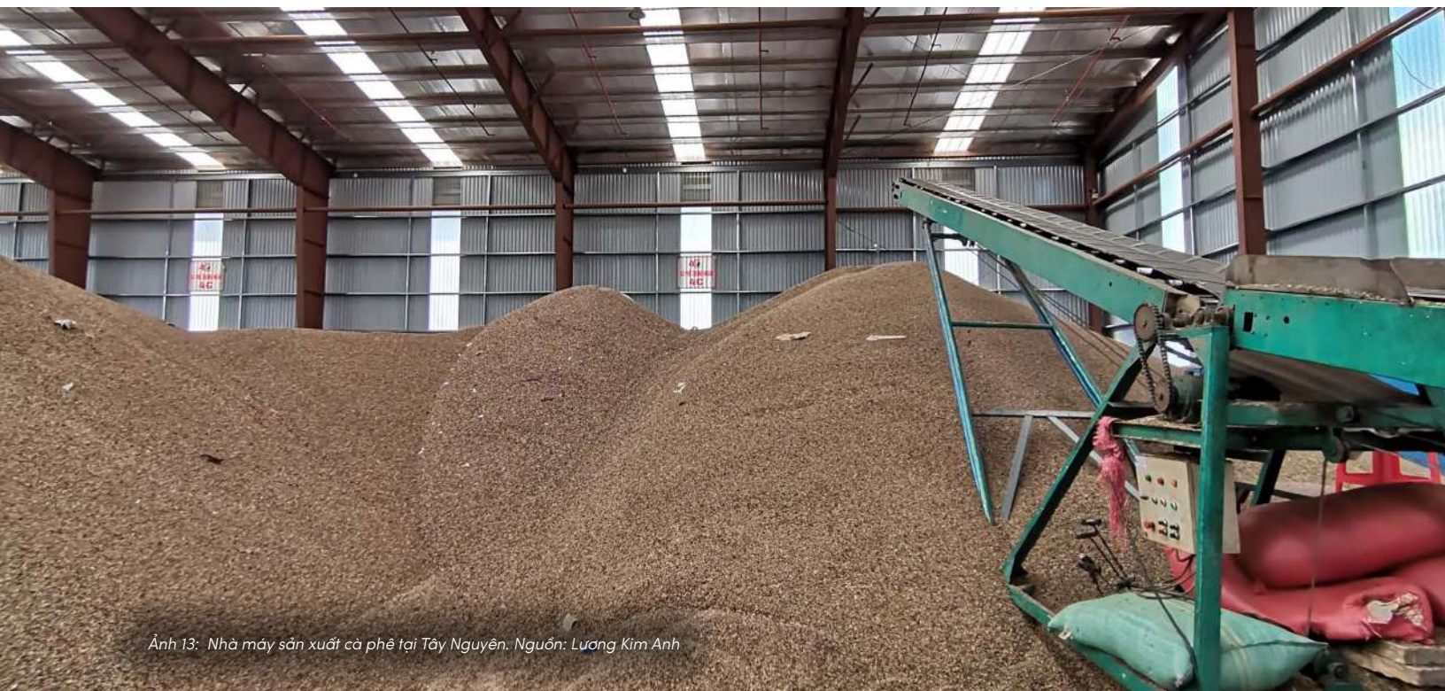
Ảnh 13: Nhà máy sản xuất cà phê tại Tây Nguyên.

Bài học rút ra: Công nghệ cao chỉ phát huy hiệu quả khi đi kèm với một cách nhìn mới về đất và hệ sinh thái sản xuất.