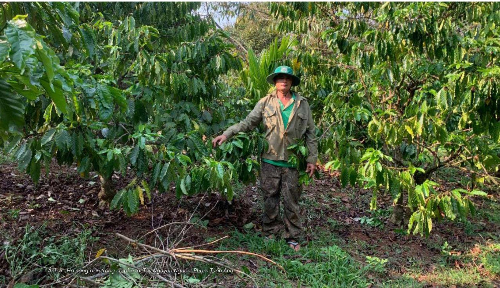
Ảnh 5: Hộ nông dân trồng cà phê tại Tây Nguyên.

Người nông dân nhận ra điều này qua thực tế: đất giữ ẩm kém hơn, dễ nứt nẻ vào mùa khô và phản ứng yếu với phân bón. Câu nói “bón nhiều mà cây không ăn” phản ánh một hệ sinh thái đất đã suy yếu đến mức không còn chuyển hóa dinh dưỡng hiệu quả.