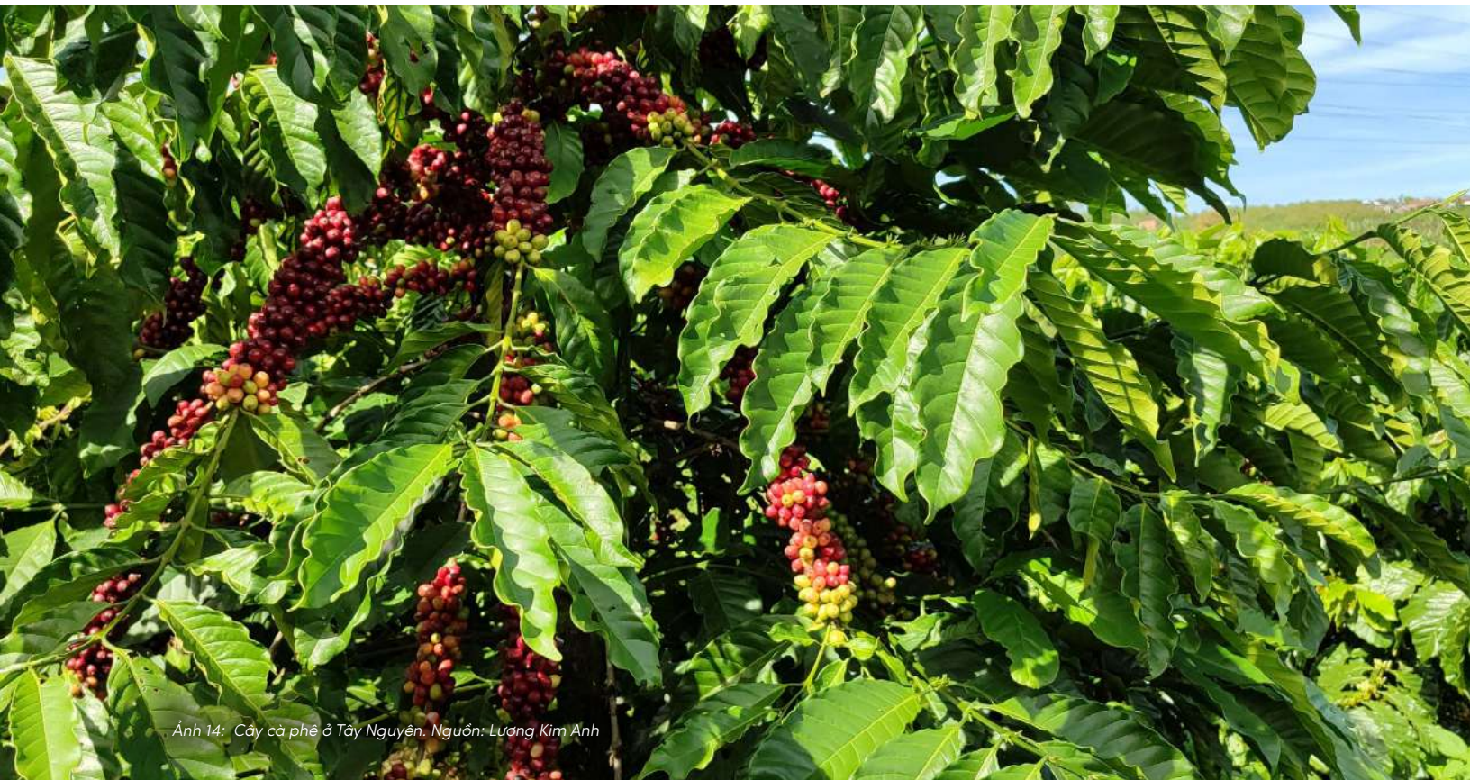
Ảnh 14: Cây cà phê ở Tây Nguyên.

Đây chính là điểm khởi đầu của Chương VII.