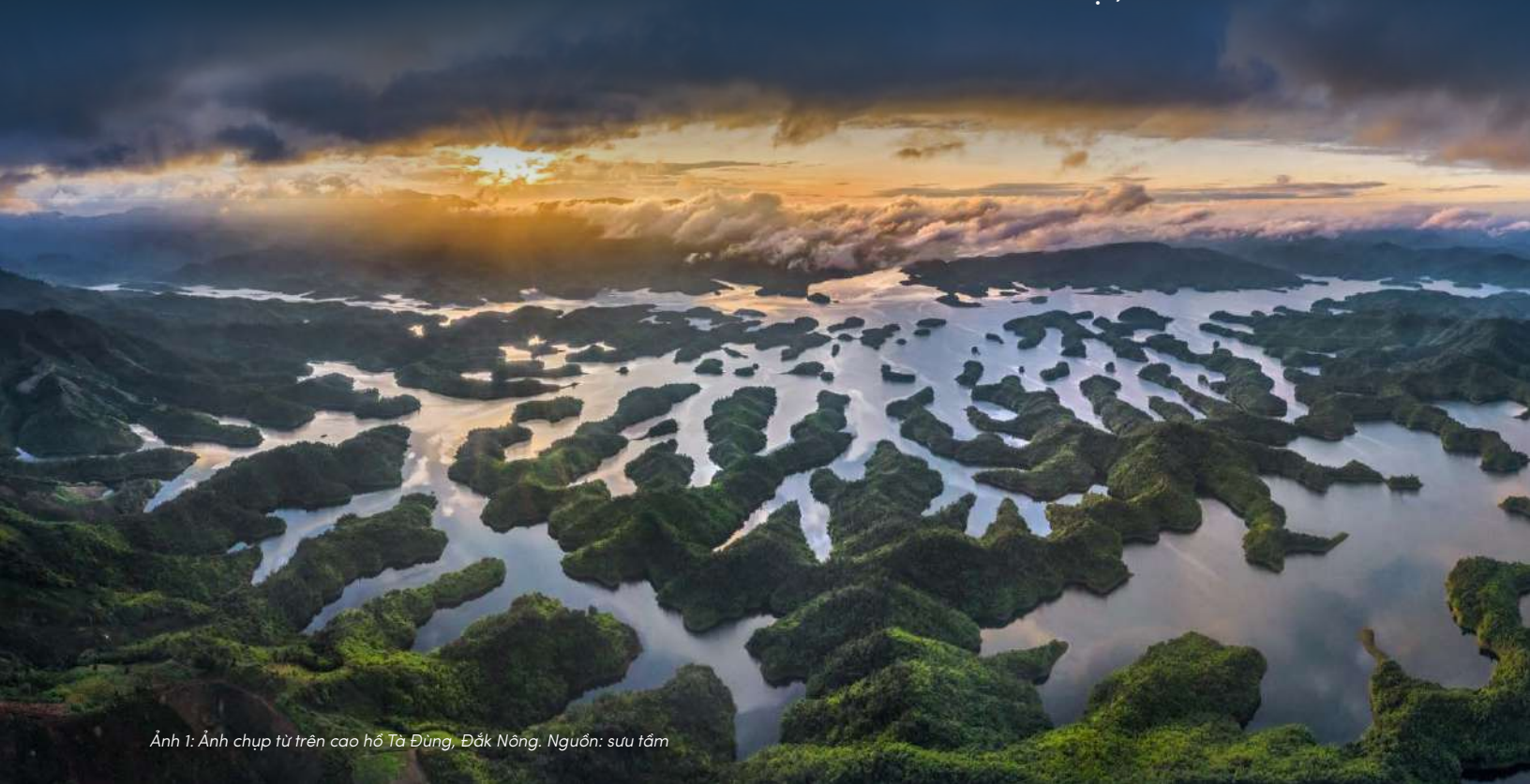
Ảnh 1: Ảnh chụp từ trên cao hồ Tà Đùng, Đắk Nông.