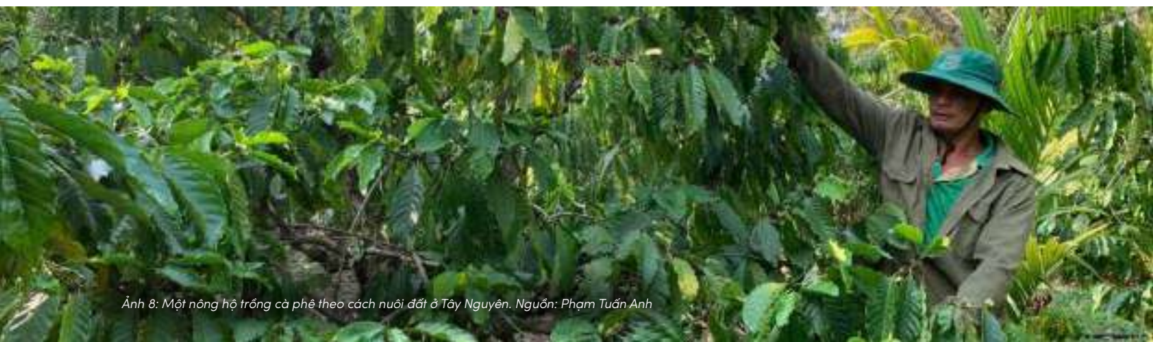
Ảnh 8: Một nông hộ trồng cà phê theo cách nuôi đất ở Tây Nguyên.

Khi thiếu một nguồn thông tin ổn định và đáng tin cậy, người nông dân buộc phải tìm đến những nơi khác để hỏi và học. Điều này thấy rõ ở những vùng sản xuất hàng hóa, nơi nhu cầu về các “cách làm nhanh” thường vượt quá khả năng đáp ứng của hệ thống công.