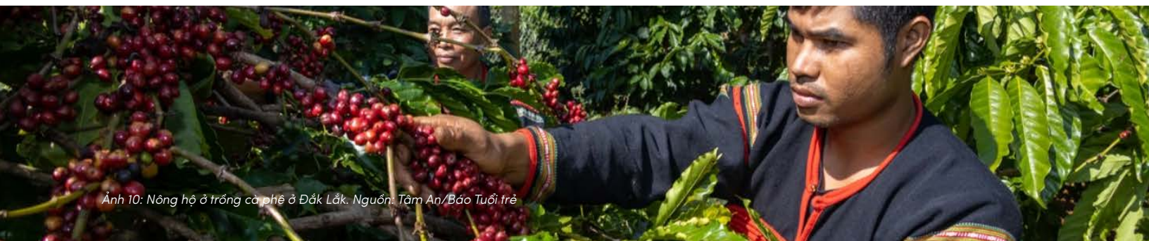
Ảnh 10: Nông hộ ở trồng cà phê ở Đắk Lắk.

Sự thay đổi này có một ý nghĩa đáng chú ý: những yếu tố trước đây ít được nhìn thấy ở cấp sản xuất — như cách quản lý đất, sử dụng đầu vào hay bảo vệ hệ sinh thái — bắt đầu có cơ hội được nhắc đến và được xem xét trong quá trình đánh giá sản phẩm.