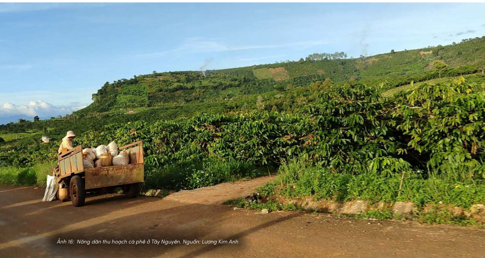
Ảnh 16: Nông dân thu hoạch cà phê ở Tây Nguyên.

Khi đất được nhìn nhận đúng như một hệ sống, mọi quyết định canh tác cũng sẽ thay đổi — không chỉ để thu hoạch cho mùa này, mà còn để giữ lại khả năng sống của đất cho những mùa sau.