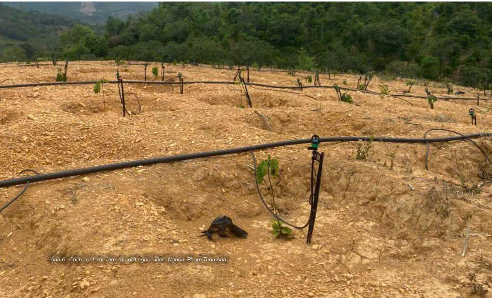
Ảnh 6: Cách canh tác làm cho đất nghèo kiệt.

Chương III sẽ đi sâu vào các thực hành canh tác — những gì đang trực tiếp định hình sức khỏe của đất.