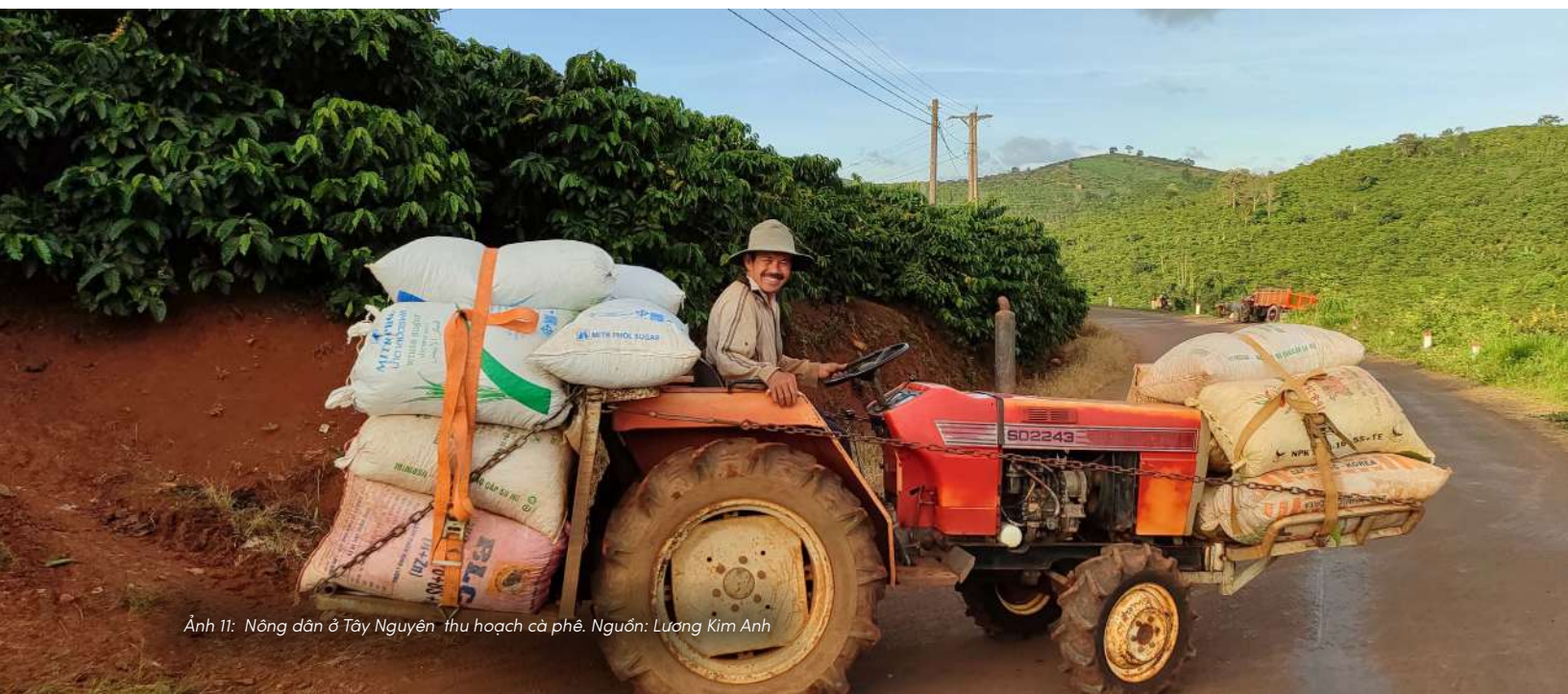
Ảnh 11: Nông dân ở Tây Nguyên thu hoạch cà phê.

Theo cách đó, câu hỏi không còn là có cần quan tâm đến đất hay không, mà là làm thế nào để những gì đang diễn ra trong đất được phản ánh rõ hơn trong cách chúng ta định giá và lựa chọn. Khi điều đó xảy ra, khoảng cách giữa sản xuất và sinh thái mới có thể dần được thu hẹp.