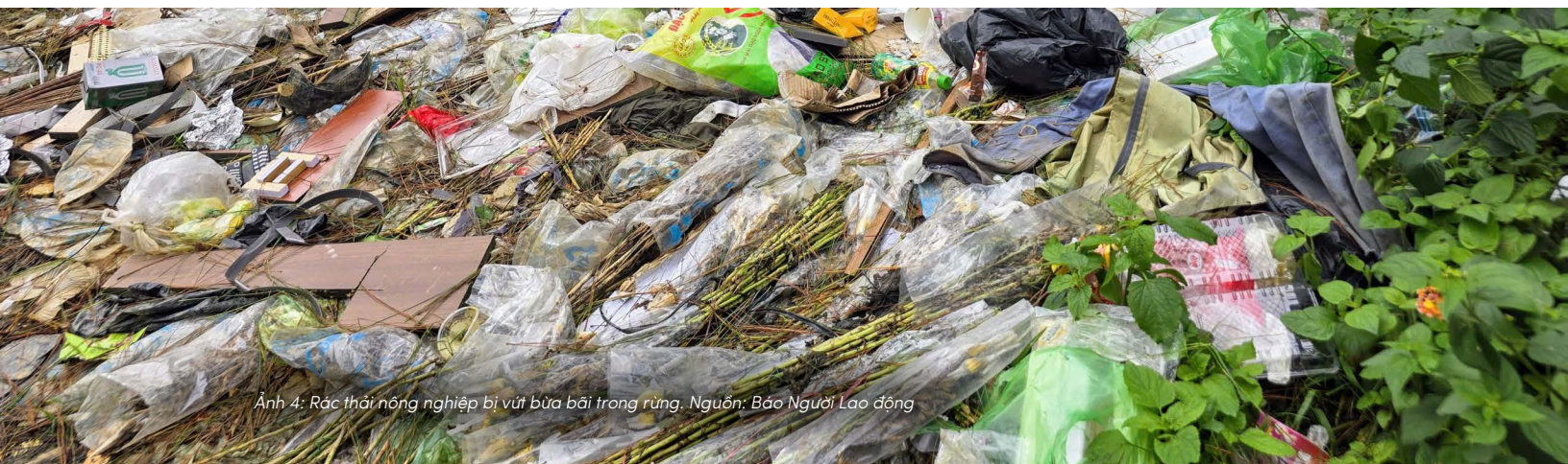
Ảnh 4: Rác thải nông nghiệp bị vứt bừa bãi trong rừng.

Nếu ở trên cho thấy một phần lớn chất thải chưa đi vào hệ thống, thì ở chiều ngược lại, ngay cả phần rác đã được thu gom cũng bộc lộ rõ những giới hạn trong năng lực xử lý của hệ thống. Theo tổng hợp từ các báo cáo của Bộ TN&MT và một số địa phương giai đoạn 2022–2024, tổng lượng bao gói thuốc bảo vệ thực vật sau sử dụng được thu gom trên cả nước đạt gần 2.500 tấn. Ngay cả khi so sánh với quy mô phát sinh hàng năm ở mức hàng chục nghìn tấn, con số này cho thấy chỉ một phần rất nhỏ chất thải thực sự đi vào hệ thống thu gom chính thức. Trong số này, chỉ khoảng 1.400 tấn được xử lý đúng quy định; khoảng hơn 500 tấn bị người dân tự tiêu hủy, thường là bằng cách đốt; và hơn 550 tấn vẫn tồn đọng tại các điểm thu gom hoặc ngoài môi trường.