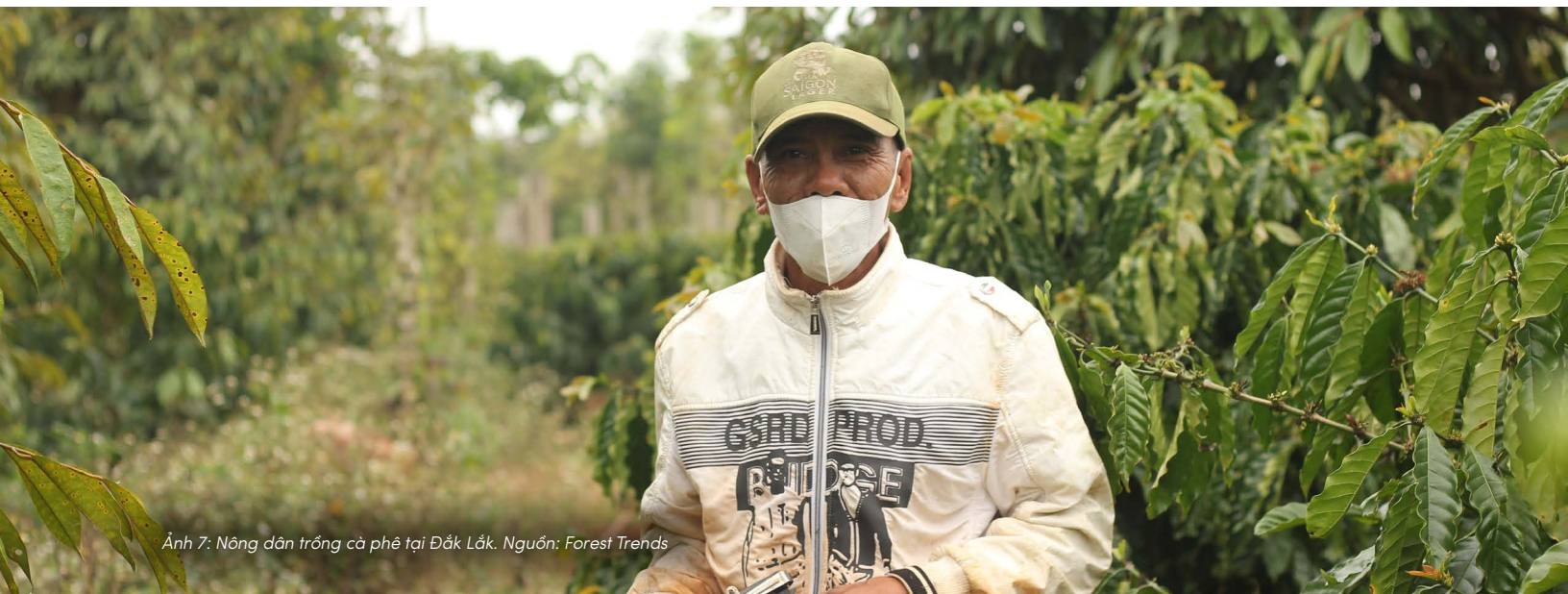
Ảnh 7: Nông dân trồng cà phê tại Đắk Lắk.

Khi người nông dân bắt đầu đặt câu hỏi về những gì họ đang sử dụng — nó đến từ đâu, để lại điều gì sau mỗi vụ mùa — họ không chỉ còn là người sản xuất, mà trở thành một tác nhân có khả năng định hình lại thị trường đầu vào. Sự thay đổi từ phía người nông dân, dù nhỏ, có thể tạo ra áp lực ngược trở lại toàn bộ chuỗi giá trị.