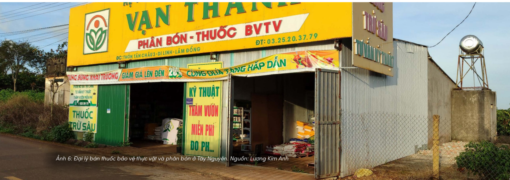
Ảnh 6: Đại lý bán thuốc bảo vệ thực vật và phân bón ở Tây Nguyên.

Mạng lưới đại lý vật tư nông nghiệp vốn đã hiện diện rộng khắp tại Tây Nguyên chính là “mạch máu” sẵn có để vận hành hệ thống này. Nếu biến mỗi đại lý thành một điểm tiếp nhận, việc thu gom và xử lý rác thải sẽ có một lối ra rõ ràng. Chỉ khi dòng tài chính từ EPR được khơi thông để chi trả thực chất cho khâu vận chuyển và xử lý, chúng ta mới chấm dứt được tình trạng “có điểm tập kết nhưng tắc nghẽn dòng chảy xử lý”.