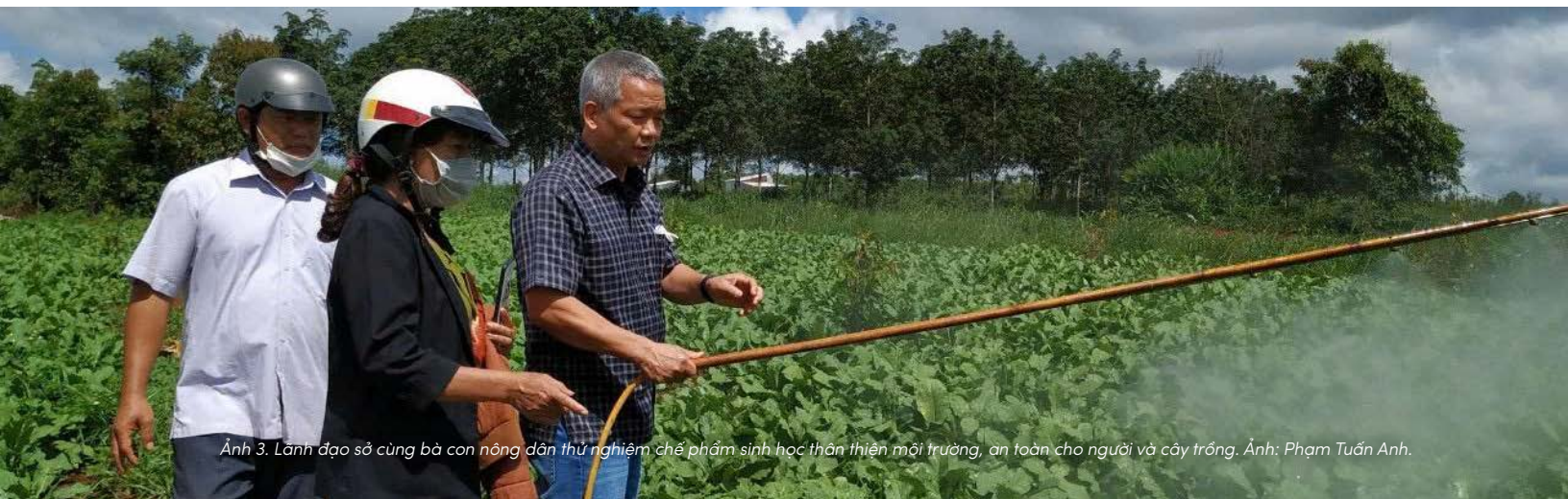
Ảnh 3. Lãnh đạo sở cùng bà con nông dân thử nghiệm chế phẩm sinh học thân thiện môi trường, an toàn cho người và cây trồng.

Trong cấu trúc hiện tại, người nông dân vừa là người sử dụng sản phẩm, vừa là người phải gánh chịu hệ quả cuối cùng của những quyết định được đưa ra ở các tầng phía trên mà họ không có quyền tham gia.