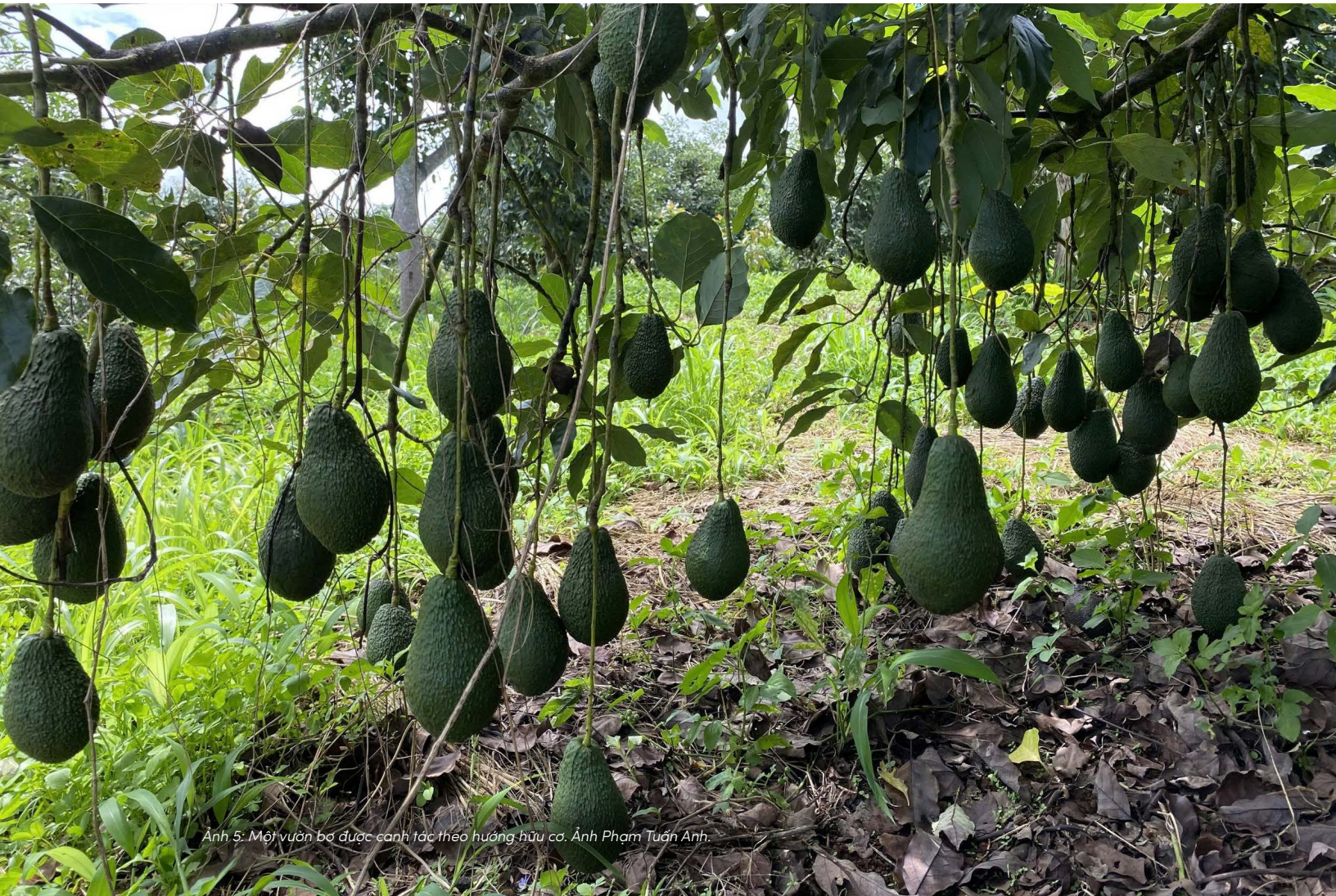
Ảnh 5: Một vườn bơ được canh tác theo hướng hữu cơ.

Nói cách khác, giá nông sản hiện nay mới chỉ phản ánh chi phí sản xuất trực tiếp, mà chưa bao gồm đầy đủ chi phí môi trường mà hệ thống sản xuất đang chuyển giao cho tương lai.