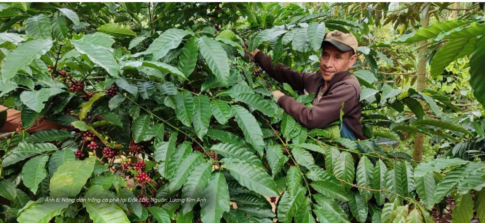
Ảnh 6: Nông dân trồng cà phê tại Đắk Lắk.

Các thị trường xuất khẩu lớn ngày càng có những quy định ngặt nghèo hơn về tính hợp pháp và bền vững của sản phẩm và điều này có ý nghĩa quan trọng đối với các hoạt động sử dụng đất tại các quốc gia sản xuất. Một ví dụ điển hình của loại hình quy định này là EUDR, có hiệu lực thi hành từ 30/12/2026. Quy định này yêu cầu 7 nhóm mặt hàng, trong đó có gỗ và sản phẩm gỗ, và cà phê, khi nhập khẩu vào thị trường này phải đảm bảo quá trình sản xuất các mặt hàng này không gây mất rừng sau 31/12/2020. Ngoài ra, Quy định này cũng yêu cầu các hoạt động trong chuỗi cung ứng, bao gồm cả hoạt động sử dụng đất, phải tuân thủ với tất cả các yêu cầu của quốc gia sản xuất. EUDR cũng yêu cầu các mặt hàng chịu sự điều chỉnh của quy định này phải truy xuất được đến từng lô đất sản xuất.