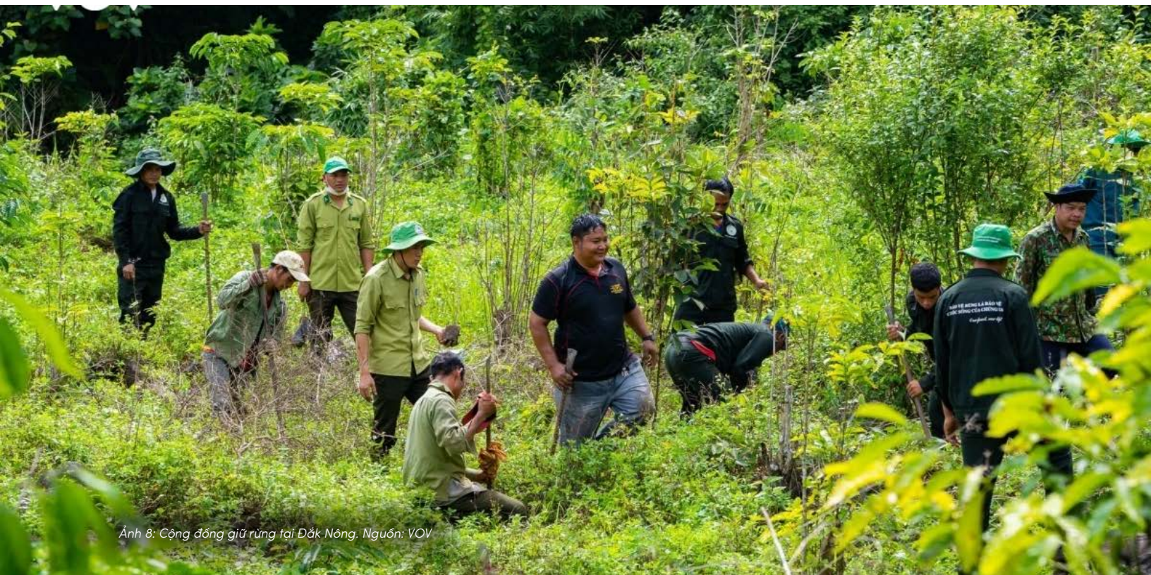
Ảnh 8: Cộng đồng giữ rừng tại Đắk Nông.

Cuối cùng, đối với gói giải pháp dài hạn, Chính phủ nên chuyển đổi các diện tích đất mà xã đang quản lý này cho các nhóm chủ rừng khác (ví dụ các công ty lâm nghiệp, ban quản lý, hộ, cộng đồng,...). Thực hiện việc chuyển đổi này đòi hỏi Chính phủ xây dựng kế hoạch cụ thể và bố trí nguồn lực cần thiết để triển khai kế hoạch này. Quá trình xây dựng kế hoạch cần có sự tham gia trực tiếp của các bên liên quan, đặc biệt là cơ quan quản lý địa phương và cộng đồng.