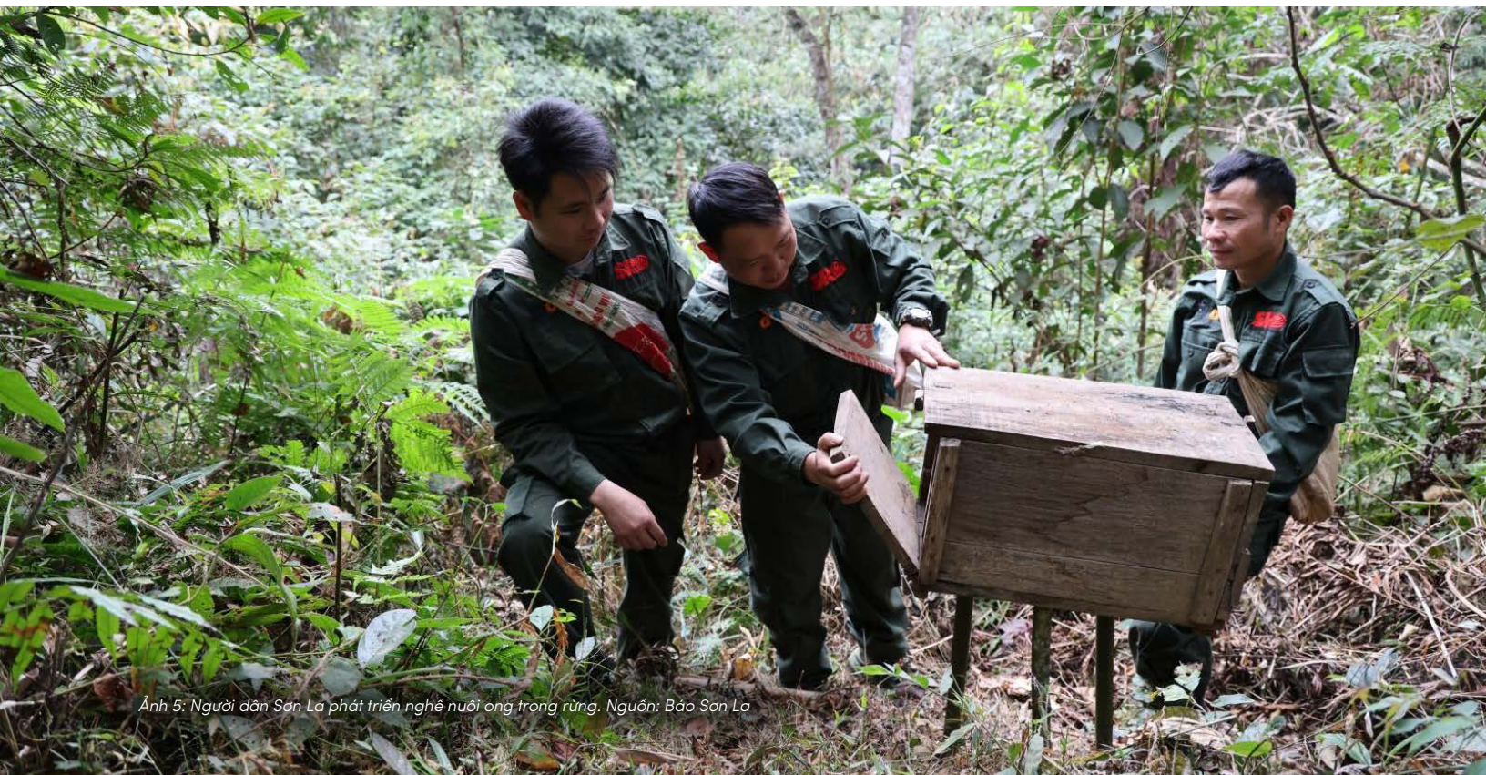
Ảnh 5: Người dân Sơn La phát triển nghề nuôi ong trong rừng.