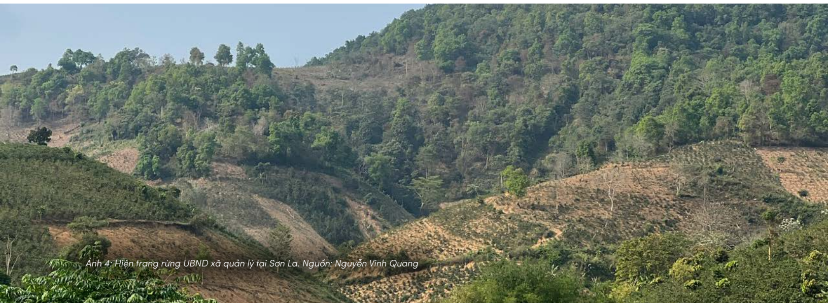
Ảnh 4: Hiện trạng rừng UBND xã quản lý tại Sơn La.