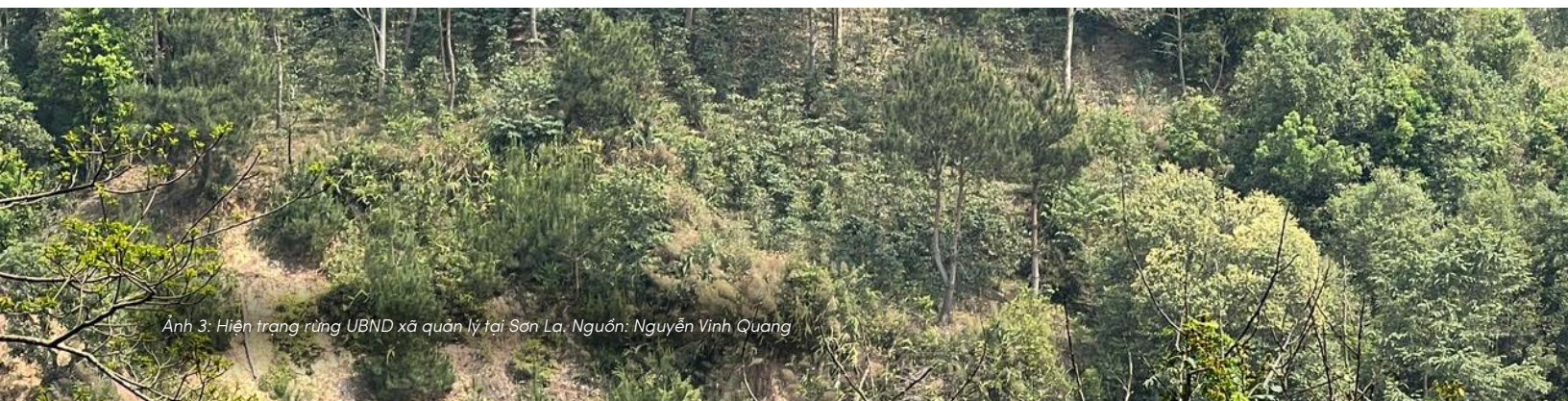
Ảnh 3: Hiện trạng rừng UBND xã quản lý tại Sơn La.