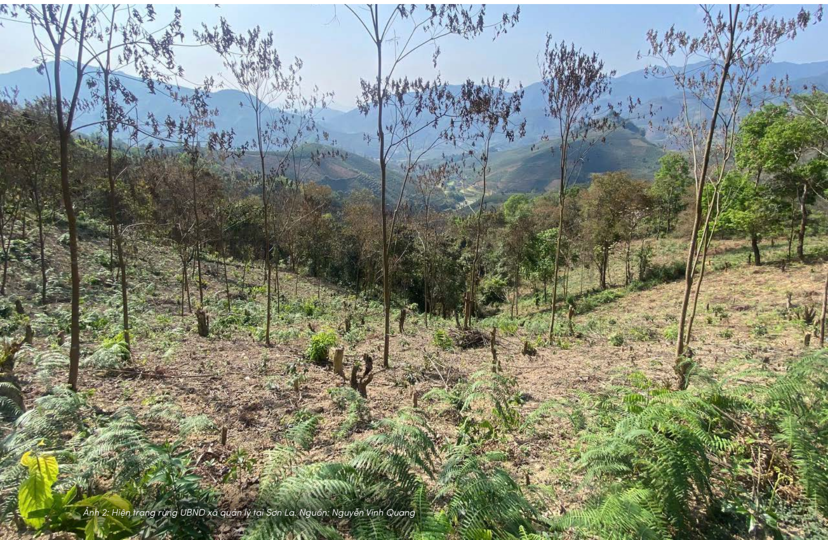
Ảnh 2: Hiện trạng rừng UBND xã quản lý tại Sơn La.

Phần 2 cung cấp một số thông tin từ khảo sát thực địa về thực trạng sử dụng đất rừng mà UBND xã hiện đang quản lý tại một số địa phương.