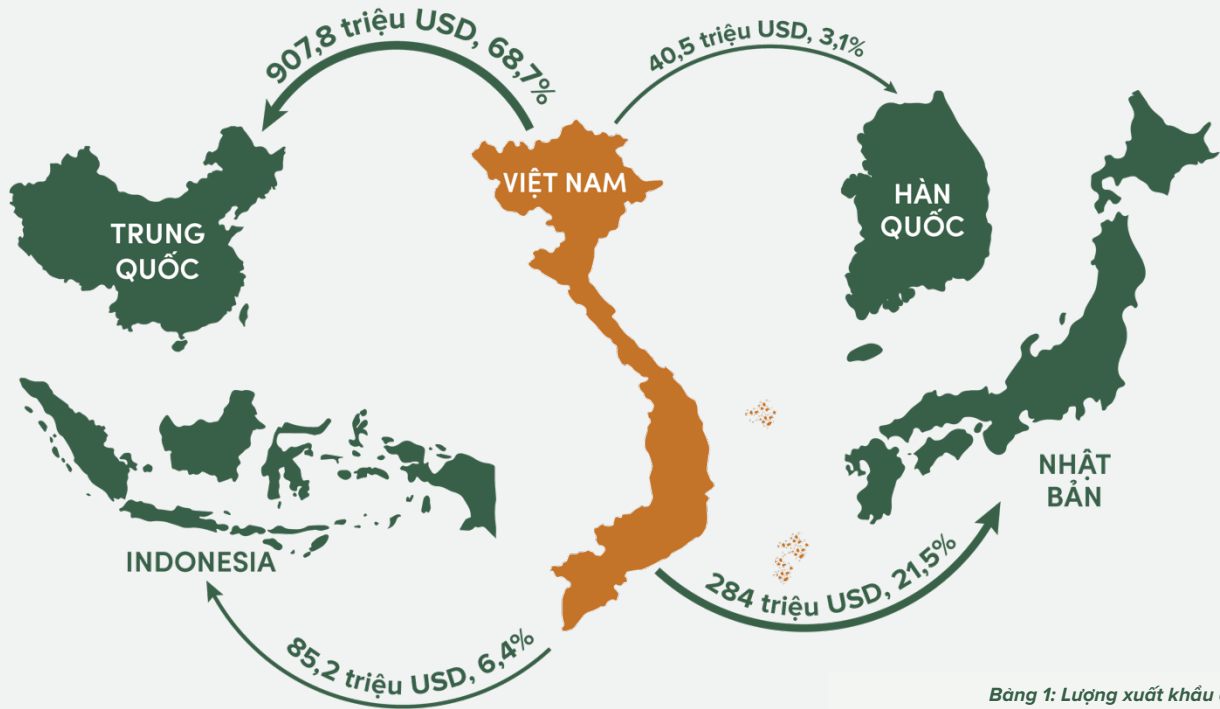
Bảng 1: Lượng xuất khẩu dăm gỗ của Việt Nam trong 6T/2024